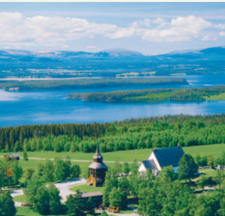
Frösö kirke er en av Sveriges mest kjente kirker.