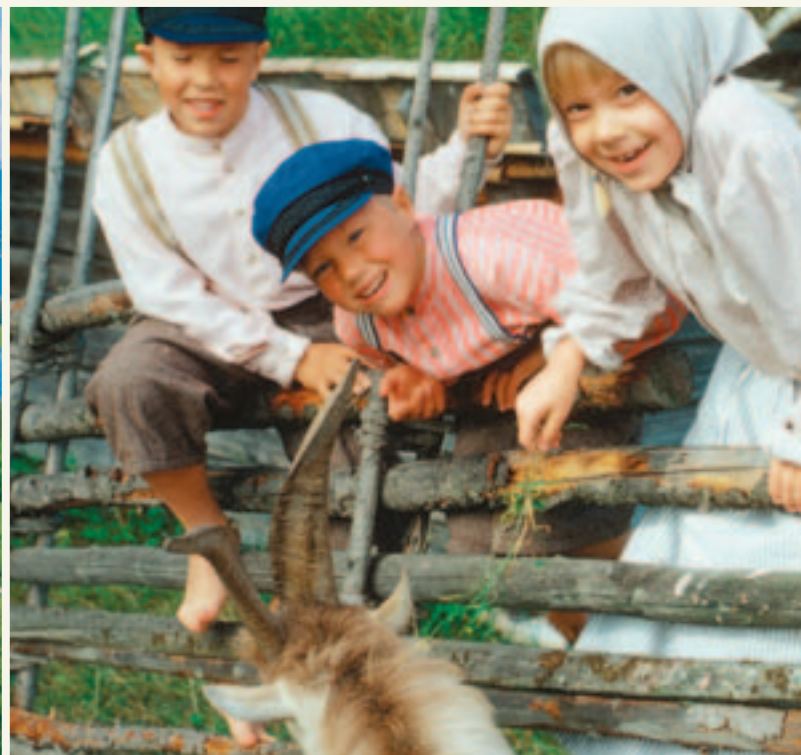
Jamtli historieland – en stor sommeropplevelse for barna.

satt pris på av både voksne og barn. Utfordre familien i klatreveggen og taubroen, eller prøv en fortumlede taubaneferd blant tretoppene. For de minste barna finnes det en eventyrsti der de møter hekser og troll. På Östersunds motorstadion er det mulig å prøve gokart 7.